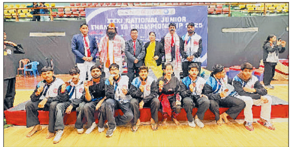
रोहतक। विजेता खिलाड़ी अपने पदक के साथ।