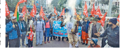
रोहताक। अमेरिका के राष्ट्रपति डोनाल्ड ट्रंप के खिलाफ जोरदार विरोध प्रदर्शन करते नागरिक मंच के बैनर तले विभिन्न सामाजिक संगठनों के सदस्य।