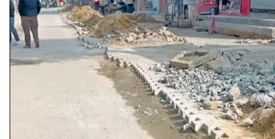
रोहतक। निर्माणधीन सड़क पर टाइल बिछाते हुए और सड़क बनाने का विरोध करते हुए स्थानीय निवासी।