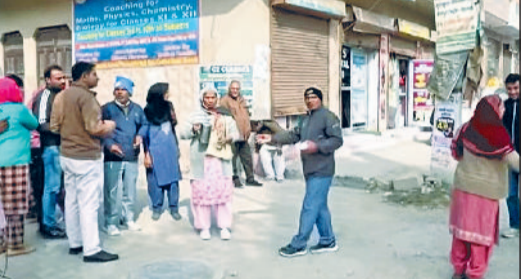
रोहतक। निर्माण कार्य के दौरान सड़क किनारे बने कई मकानों के रैंप भी तोड़े जा रहे हैं, जिससे लोगों की परेशानी और बढ़ गई है। स्थानीय लोगों का कहना है कि ये रैंप उन्होंने अपने निजी कार्य करवाया जा रहा है। इस पूरे निर्माण कार्य पर करीब 92 लाख की लागत आएगी।