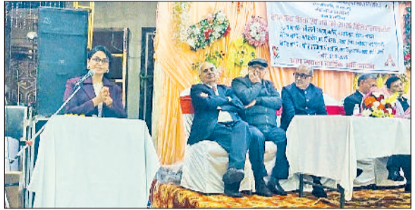
रोहतक। आयोजित कार्यक्रम को सम्बोधित करते मुख्य वक्ता।