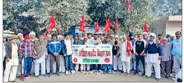
किसान उपायुक्त कार्यालय पर प्रदर्शन को मजबूर होने