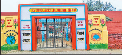
तीनों खंडों के छह सरकारी स्कूलों ने अपने अपने वर्ग में प्रथम स्थान प्राप्त किया

रोहताक। सरकारी स्कूलों के सुंदरीकरण और बेहतर शैक्षणिक वातावरण तैयार करने के लिए किए गए प्रयासों के सकारात्मक परिणाम सामने आए हैं। मुख्यमंत्री स्कूल सौंदर्यीकरण पुरस्कार योजना के तहत वर्ष 2025-26 के लिए कलानौर, रोहताक और महम खंड के स्कूलों के परिणाम घोषित किए गए हैं। इन नतीजों में तीनों खंडों के छह सरकारी स्कूलों ने अपने-अपने वर्ग में प्रथम स्थान प्राप्त किया है।